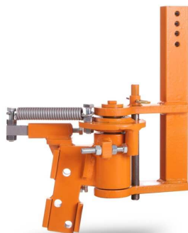
Support à tondeuse