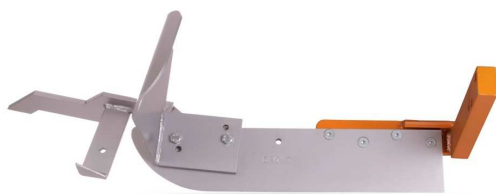
Lame avec versoir et cure-ceps