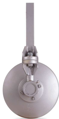
Disque lisse 1 orientation