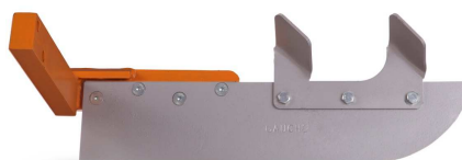
Lame avec dents