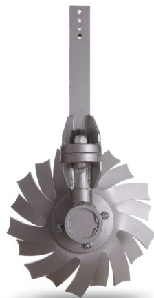
Disque émotteur 1 orientation