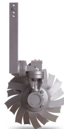
Disque émotteur 2 orientations