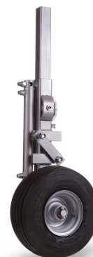
Roue pneumatique à réglage hydraulique