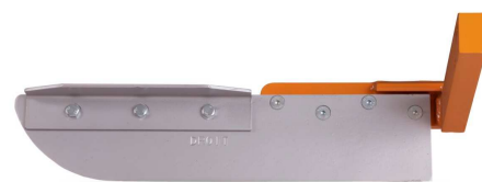
Lame avec cornière